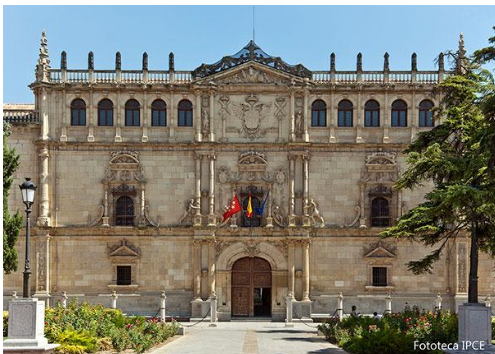
Fachada de la Universidad de Alcalá

Instituto Universitario de Investigación en Estudios Latinoamericanos – Universidad de Alcalá